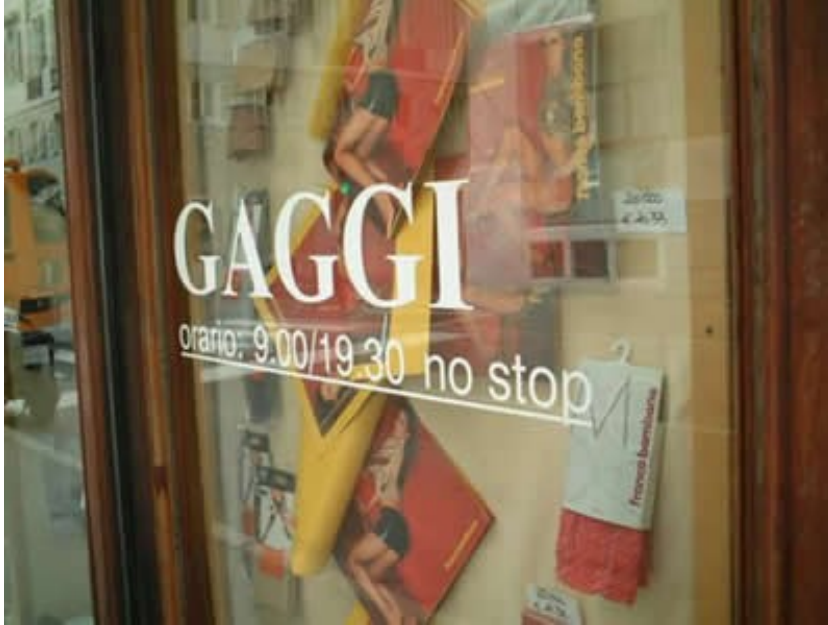
Solo Exhibition GaggiNoStop