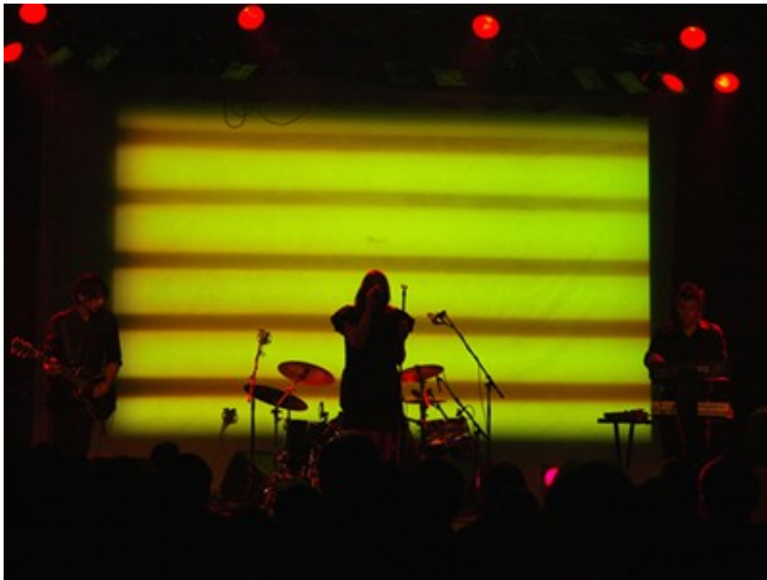
Concert Visuals Division Kent