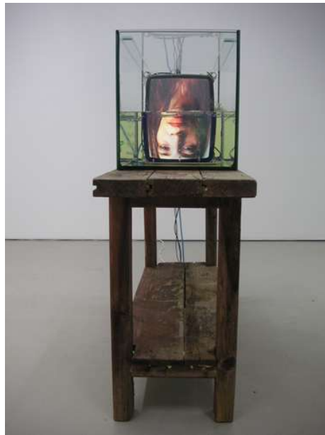
MARCK Human air system, 2005 47 x 15 x 47 in / 119.4 x 38.1 x 119.4 cm tube-tv, glass, liquid video sculpture, 03:41 movie loop