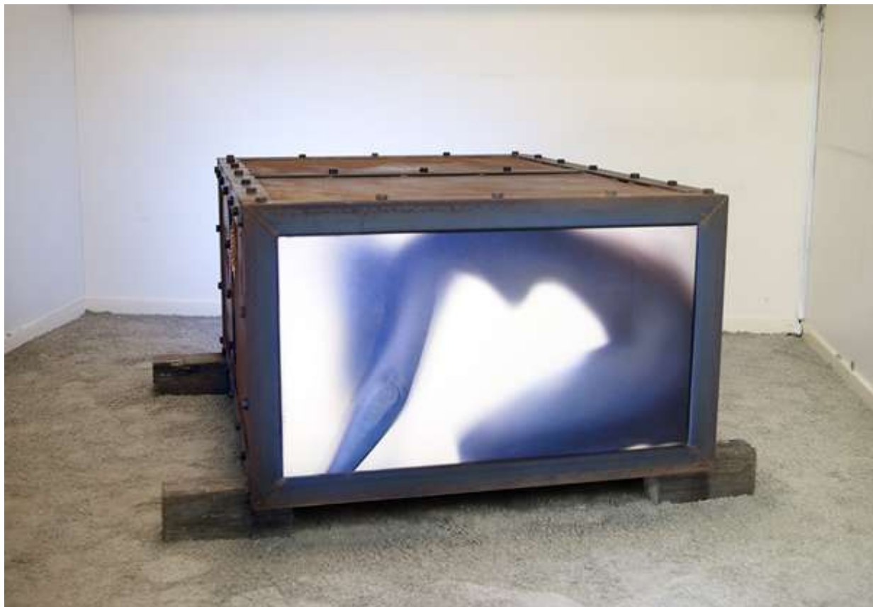
Pandoras Box, 2005 / 25.6 x 17.7 x 55.1 in / 65 x 45 x 140 cm / Video Sculpture