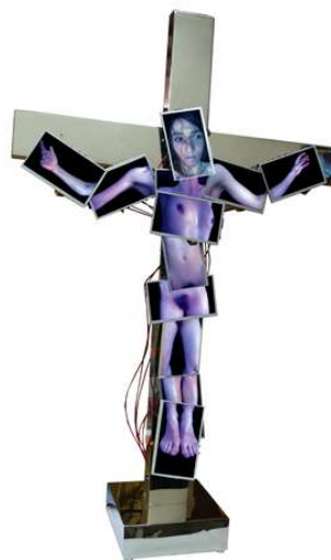
MARCK Kreuz, 2009 42 x 27 x 9 in / 106.7 x 68.6 x 22.9 cm LCD pannel, iron video sculpture, 499 pictures loop