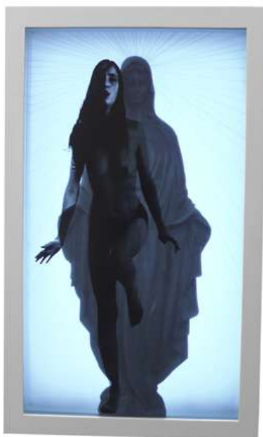
MARCK Maria II, 2010 35 x 21 x 7 in / 88.9 x 53.3 x 17.8 cm LCD, wood, glass video sculpture, 36:49 movie loop